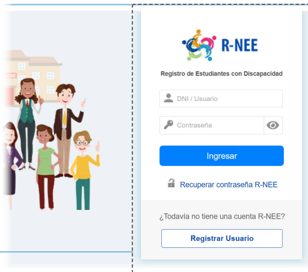
Pantalla de acceso al sistema de registro.

Es responsabilidad del director de la IE completar esta información o designar a un encargado para esta tarea.